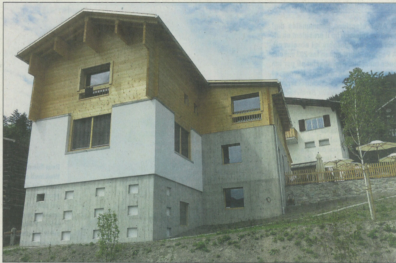
Il Hotel Steila a Siat ei numnaus ella gliesta da 91 objects dalla Protecziun dalla patria. Igl ei il sulet hotel baghegiar da niev. MAD

El rapport dall'Ustria Steila puntuescha la Protecziun dalla patria l'integriziun dil baghetg el vitg pign. «Il material da baghegiar, ils mistergners, igl ustier e las spisas derivan dalla regiun.» Il hotel seigi acceptaus el vitg e detti a quel in tec dapli qualitad. Ils detagls dil mobiliar sco dil baghetg intern elaborai cunscienzius seigien buca pretensius ni mulestus ed igl architect da