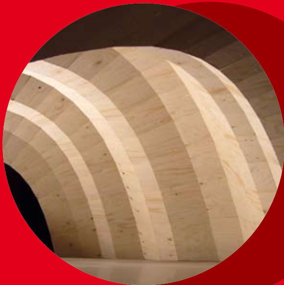
TABLE RONDE ARCHITECTURE